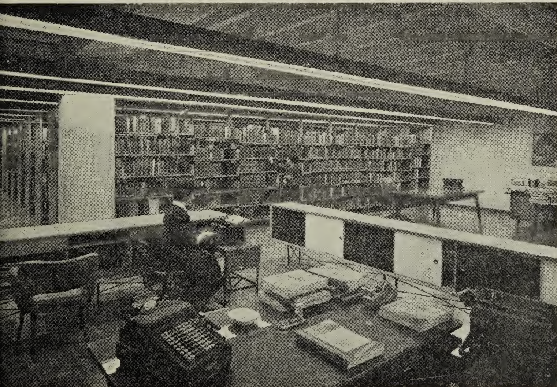
BIBLIOTECA LUIS ANGEL ARANGO